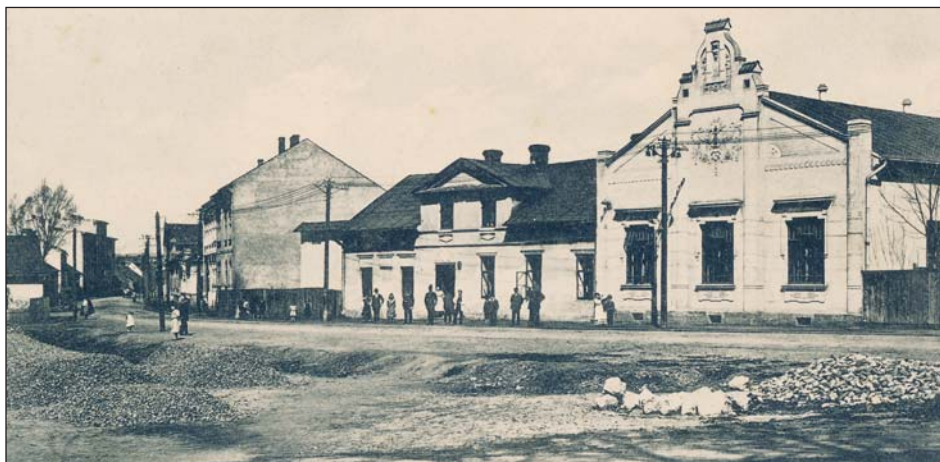
HAVRÁNKŮV HOSTINEC, vlevo původní budova hostince, vpravo přístavba sálu z roku 1909. Stav okolo roku 1920.